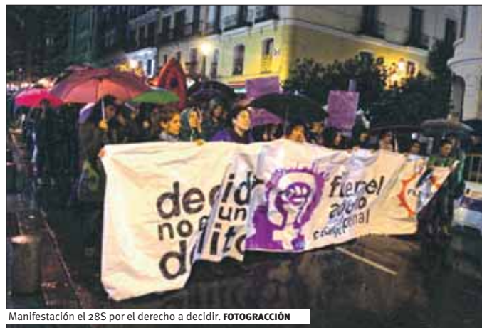
Manifestación el 28S por el derecho a decidir. FOTOGRAFACIÓN

Desde Feminismos 15M denunciamos el nuevo ataque a nuestros derechos que planea sigilosamente el Gobierno. Estamos ante una poderosa ofensiva de los poderes económicos para reforzar el modelo de sociedad neoliberal impuesto en todos los ámbitos: el económico, el de las relaciones sociales y con la naturaleza. Este modelo profundiza en las exclusiones y desigualdades estructurales del sistema patriarcal y capitalista. Con la crisis económica llega la crisis del régimen democrático por la que se nos quitan y cuestionan derechos que pasan a considerarse privilegios, se privatizan y quitan servicios intentando que nos sometamos a la lógica del mercado al menor coste posible. Los efectos que tiene para las mujeres la profundización en la división sexual del trabajo que acarrea esta crisis se ejemplifica en la ley de dependencia, por cómo se pretende volver a responsabilizar en exclusiva a las mujeres de la reproducción social en el marco de la familia tradicional. ¡Nos quieren meter de nuevo en casa!