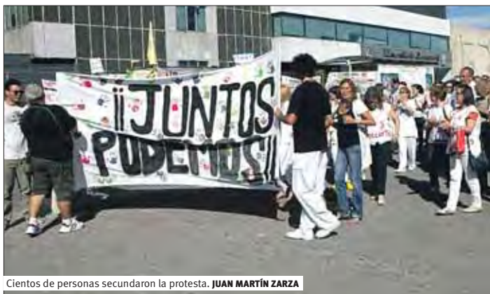
Cientos de personas secundaron la protesta. JUAN MARTÍN ZARZA

El 13 de septiembre se llevó a cabo una acampada en la puerta principal del Hospital de la Paz para protestar contra los recortes, las privatizaciones de servicios en el sistema de salud y el despido de