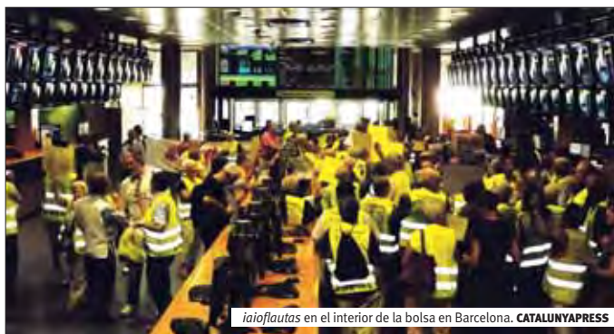
iaioflautas en el interior de la bolsa en Barcelona.

Los iaioflautas han llevado a cabo esta mañana una de sus "travesuras" en la bolsa de Barcelona. Unos noventa activistas han ocupado el que consideran «el símbolo e instrumento de la organización criminal del 1%» para denunciar que el dinero del rescate «no irá a parar a los que formamos parte del 99%, sino que irá directamente a las bolsillos de los que han provocado la crisis».