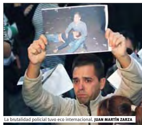
La brutalidad policial tuvo eco internacional. JUAN MARTÍN ZARZA

Las protestas convocadas bajo el lema «Rodea el Congreso» han supuesto, a lo largo de las jornadas del 25, 26 y 29 de septiembre, la reactivación del tejido crítico previamente movilizado frente a la crisis económica y de legitimidad del sistema político. Pero, además, se han convertido en un laboratorio de experimentación de una vuelta de tuerca en la política represiva que ya se había aplicado previamente en Cataluña.