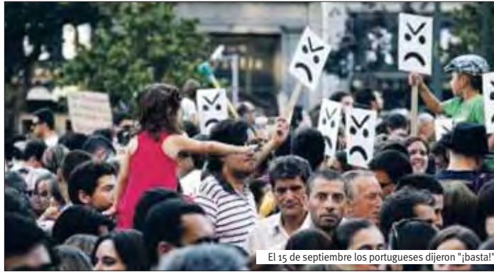
El 15 de septiembre los portugueses dijeron "¡basta!"

Miles de personas protestaron en la Praça Humberto Delgado, en la Avenida dos Aliados,