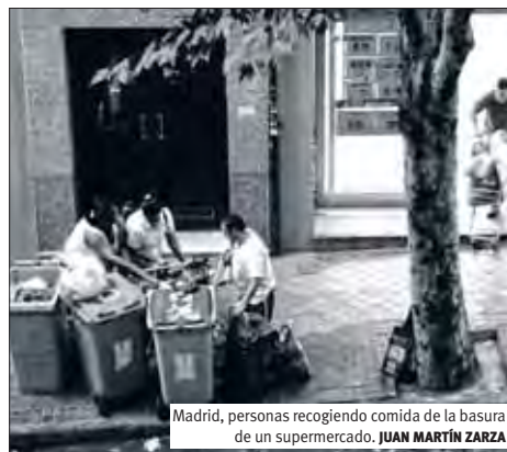
Madrid, personas recogiendo comida de la basura de un supermercado. JUAN MARTÍN ZARZA

El mes pasado, el periódico estadounidense The New York Times publicó una serie de quince fotografías que retratan el aumento de la pobreza en España. Y muchos se han apresurado a decir que es una «deformación», «manipulación» o «distorsión» de la situación actual. Nada más lejos de la realidad.