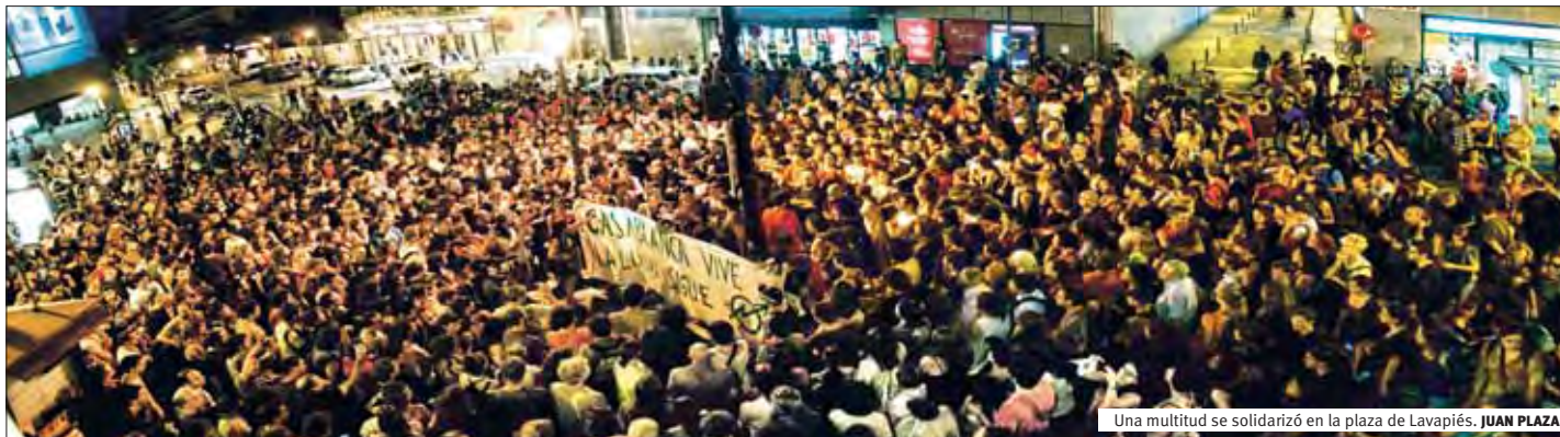
Una multitud se solidarizó en la plaza de Lavapiés. JUAN PLAZA