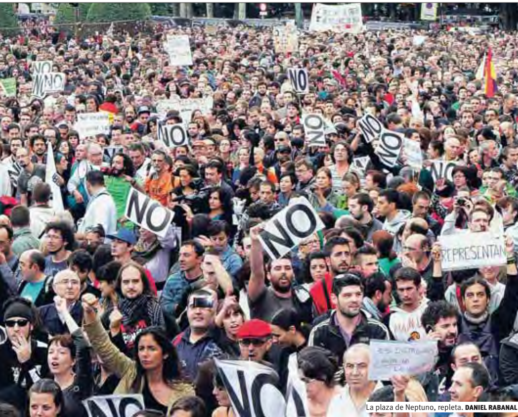
La plaza de Neptuno, repleta. DANIEL RABANAL