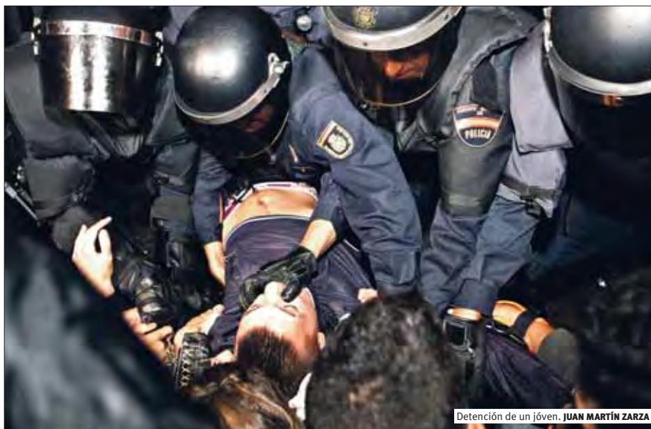
Detención de un joven. JUAN MARTÍN ZARZA

La mañana del 25S, el congreso amaneció cercado. Hasta nueve autobuses de personas que pretendían asistir a la movilización fueron retenidos en los accesos a Madrid, siendo sus pasajeros identificados y cacheados. Las sucesivas cargas de la primera jornada dejaron un saldo represivo de 35 detenidos, que a día de hoy han sido remitidos a la Audiencia Nacional tras un tenso rifirrafe entre juzgados. En esta movilización hubo más de un centenar de heridos; a ello hay que añadir tres detenidos en la jornada del 26 y dos en la del 29, además de varias personas heridas de nuevo en las cargas. Las imágenes de la brutalidad policial no solo dieron la vuelta a internet, sino que saltaron