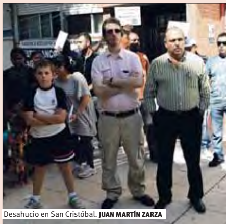
Desahucio en San Cristóbal. JUAN MARTÍN ZARZA

Si habéis seguido las crónicas de los desahucios que la Plataforma de Afectados por la Hipoteca de Madrid hace para el Madrid15M , habréis visto que, crónica tras crónica, siempre hay un banco que supera en desahucios a los demás. Por si fuera poco, es un banco que hemos rescatado entre todas y todos. Ese banco se llama Bankia, y en septiembre no ha sido menos: Bankia ha tratado de echar a seis familias de sus casas.