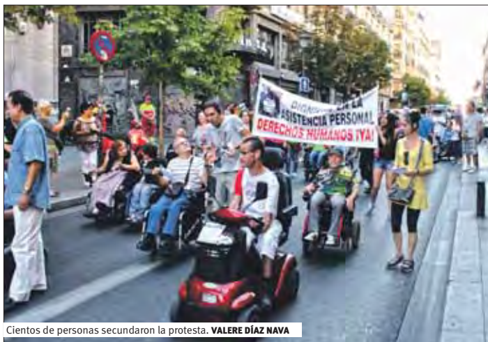
Cientos de personas secundaron la protesta. VALERE DÍAZ NAVA