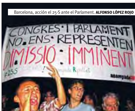
Barcelona, acción el 25-S ante el Parlament.

La acción comenzó a las 6 de la tarde y coincidió con uno de los debates de política que habitualmente se celebran en el Parlament, hecho que facilitó el sentido general de la protesta que, bajo lemas como "Congreso y Parlament, dimisión in-