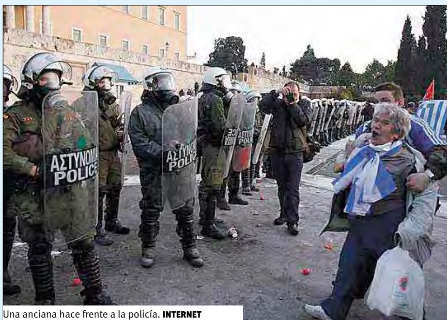
Una anciana hace frente a la policía.

Los medios hablan de jóvenes antisistema, pero no hablan de mujeres y hombres ancianos con sus mascarillas antigás mostrando su apoyo durante horas, golpeando rítmicamente las verjas de los bancos y las multinacionales con manos y pies, silbando y gritando en apoyo a las primeras lí-