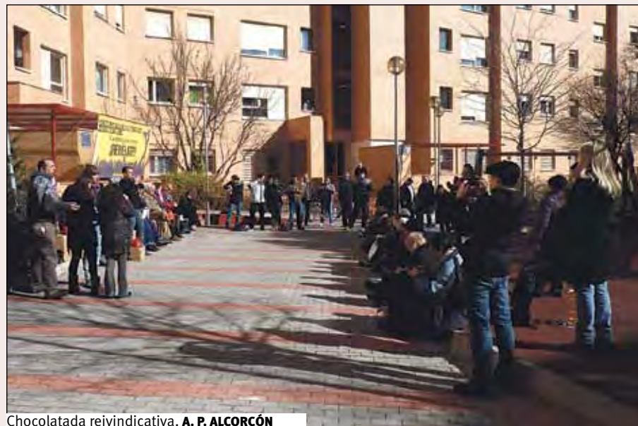
Chocolatada reivindicativa. A. P. ALCORCÓN

En los últimos años nos hemos habituado a que se produzca una cantidad escandalosa de desahucios ejecutados por impago de hipotecas y alquileres. Pero otros casos, hasta ahora poco conocidos, pueden ser el comienzo de algo más escandaloso e injusto si cabe: los desahucios de personas que han pagado puntualmente y que además viven en casas de protección oficial.