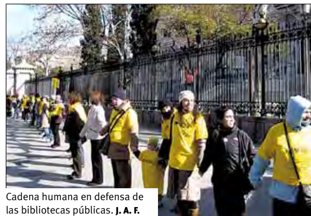
Cadena humana en defensa de las bibliotecas públicas. J. A. F.

El pasado mes de febrero arrancó la campaña "Marea amarilla", una iniciativa surgida desde la Plataforma Contra el Préstamo de Pago en bibliotecas (PCPP). Bajo el lema "Las bibliotecas no son un gasto, son una inversión", el 4 de febrero se sucedieron, por distintos puntos del país, cadenas humanas que abrazaban una biblioteca pública.