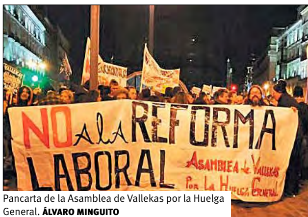
Pancarta de la Asamblea de Vallekas por la Huelga General. ÁLVARO MINGUITO