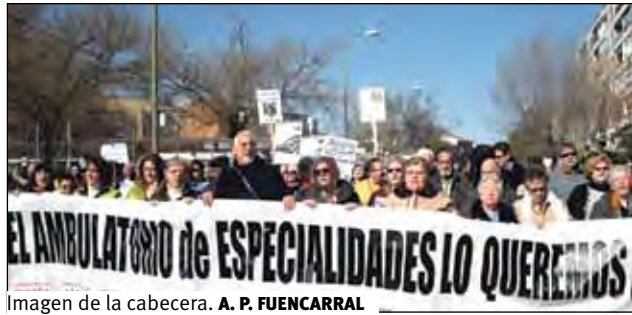
Imagen de la cabecera. A. P. FUENCARRAL

Y a todo esto, ¿qué brillante idea se le ocurre al Consejero de Sanidad para que nuestros mayores puedan ir al médico sin quedarse por el camino? Pues simplemente desviar el autobús 137 para que pase cerquita del ambulatorio de Peñagrande. ¡Y eso es todo! Realmente nos parece que se están riendo de nosotros. Pero no nos hace ni pizca de gra-