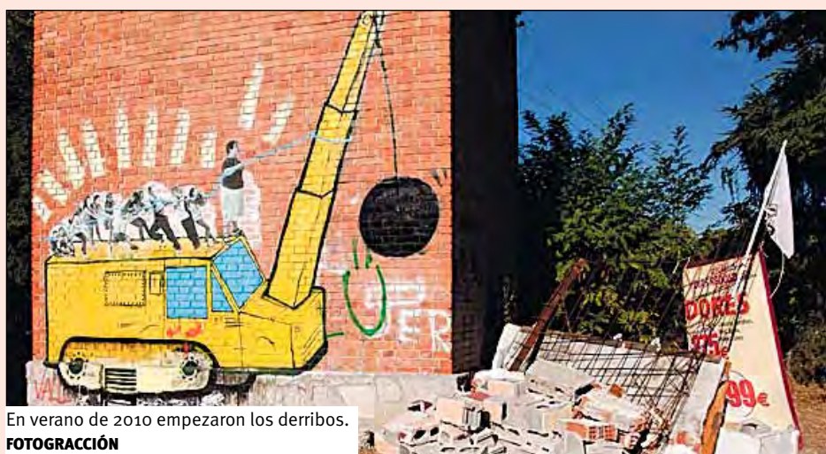
En verano de 2010 empezaron los derribos.

Durante el mes de febrero se han producido nuevos derribos en el Poblado de Puerta de Hierro, una comunidad amenazada desde 2010, año en que se producen los primeros derribos de sus viviendas. Este es, a grandes rasgos, el relato de su lucha.