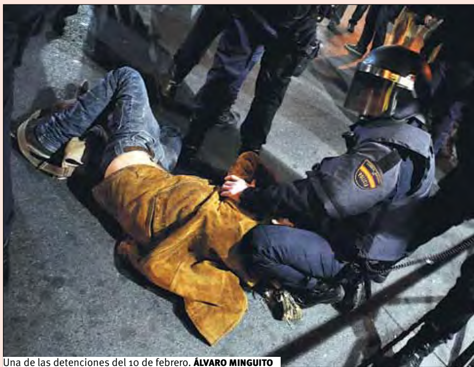
Una de las detenciones del 10 de febrero.

Más bien diremos que ha llegado un ejercicio de represión directa, bastante convencional y eficaz en los tiempos que corren, donde toda posibilidad de aminorar nuestra economía afecta de manera importante a la hora de tomar decisiones en lo que al ejercicio de los libres derechos se refiere.