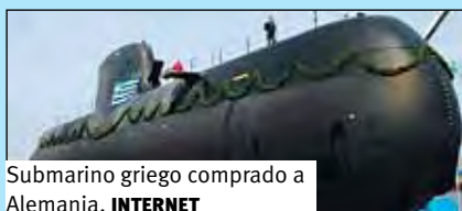
Submarino griego comprado a Alemania.

— Ante estas “coincidencias”, cabe preguntarse: “¿van unidos los rescates a la compra de armamento?”