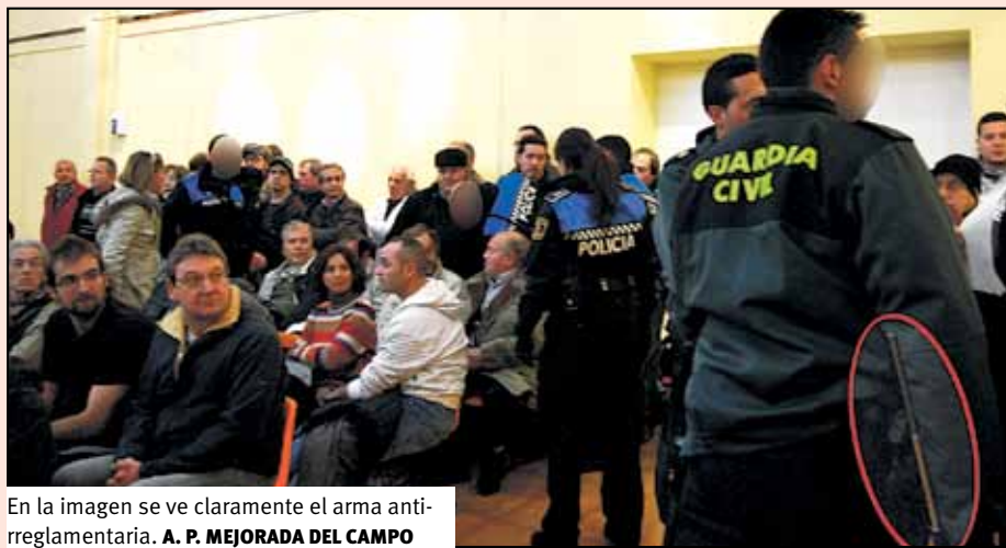
En la imagen se ve claramente el arma antirreglamentaria. A. P. MEJORADA DEL CAMPO

El pasado dos de febrero se celebró el pleno del Ayuntamiento de Loeches y, como viene siendo habitual, los vecinos y vecinas de Loeches y los pueblos afectados por el proyecto del macrovertedero del Este estaban convocados por el grupo de Medioambiente de las Asambleas del Este de Madrid para expresar su oposición al proyecto ante el alcalde del pueblo donde se pretende ubicar la instalación.