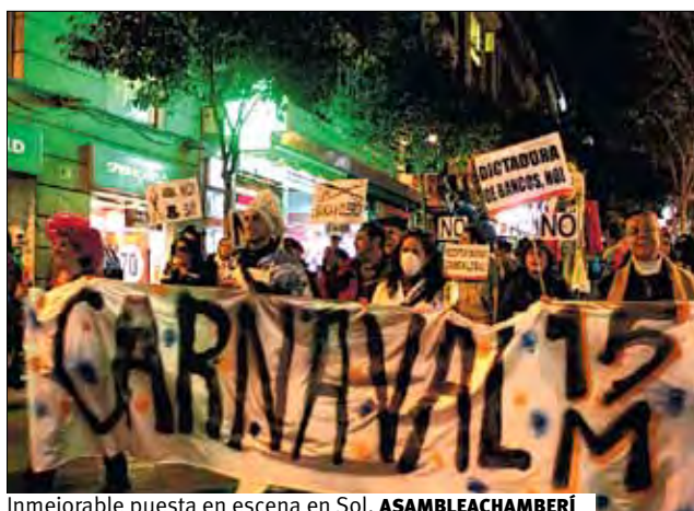
Inmejorable puesta en escena en Sol. ASAMBLEACHAMBERÍ

Con una inmejorable puesta en escena, a medida que todos ellos avanzaban en la simbólica plaza madrileña, las