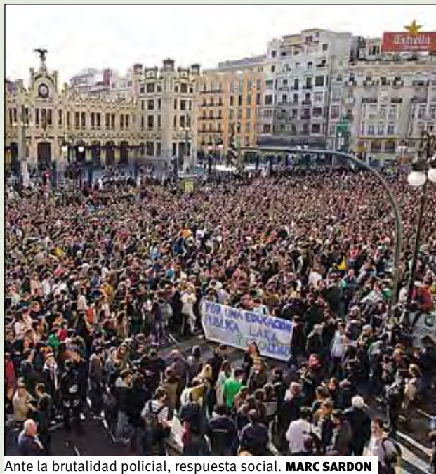
Ante la brutalidad policial, respuesta social. MARC SARDON

Tras cuatro jornadas de protestas, el balance habla por sí solo: 42 detenidos (solo el lunes 26), 7 de ellos me-