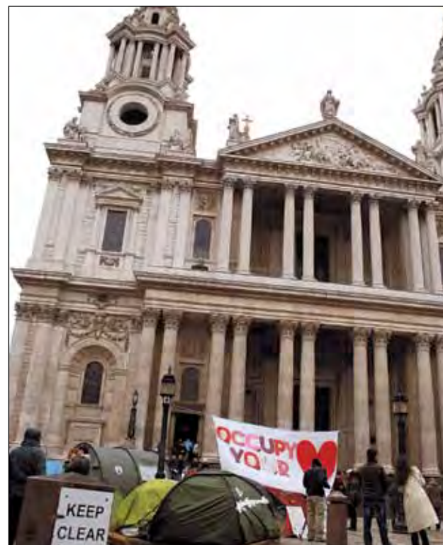
Tiendas de campaña frente a la Catedral de San Pablo. DAVID BOLLERO