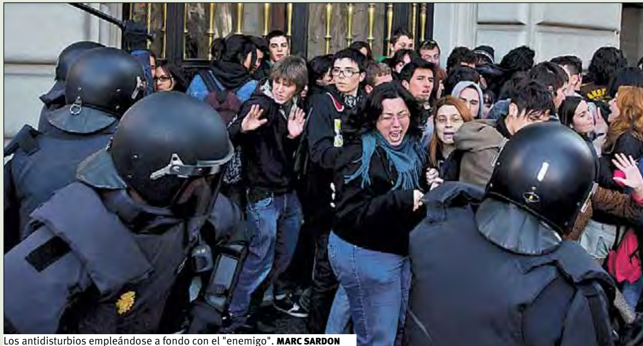
Los antidisturbios empleándose a fondo con el "enemigo".