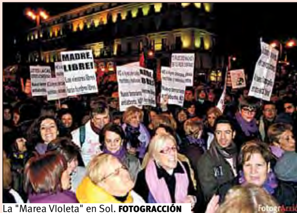
La "Marea Violeta" en Sol. FOTOGRACCIÓN

Concentraciones como la de la Puerta del Sol se repitieron por todo el país. Bajo el lema "Ni un paso atrás en políticas de igualdad. Movilízate contra los recortes", se realizaron manifestaciones hasta en 57 ciudades. En Madrid, en un ambiente festivo, se sucedieron consignas y lemas anticlericales y que expresaban la convivencia de ciertas actuaciones y declaraciones del Partido Popular con las peticiones de la Conferencia Episcopal.