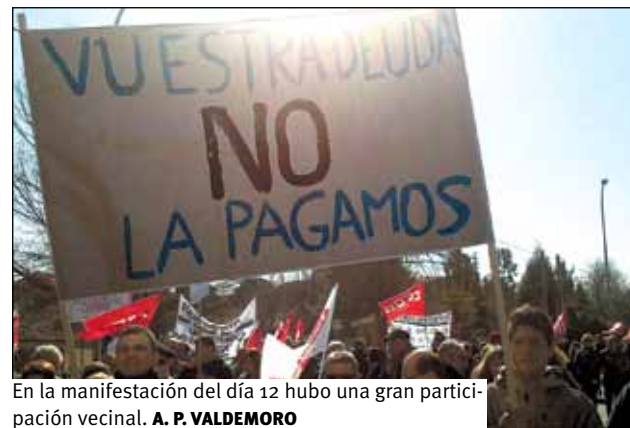
En la manifestación del día 12 hubo una gran participación vecinal. A. P. VALDEMORO

— Un equipo de gobierno (PP) que se sube el sueldo en los presupuestos de este año y que recientemente impone a los vecinos una tasa de 90€ por el servicio de recogida de basuras (¡que tam-