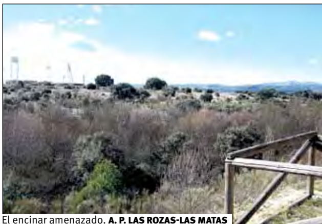
El encinar amenazado. A. P. LAS ROZAS-LAS MATAS

El pasado domingo, 19 de febrero de 2012, convocados por la Asamblea del 15M Las Rozas-Las Matas, se reunió un grupo de casi cien personas, entre asistentes y curiosos, al final de la calle Camilo José Cela, junto a la antigua fábrica de Kodak de Las Rozas, para defender de la tala indiscriminada de un encinar de alto valor ecológico, en el que se pueden encontrar más de 40 variedades de especies vegetales, entre las que destacan, aparte de las encinas por su antigüedad, los piruetanos (peral silvestre) por ser una especie protegida.