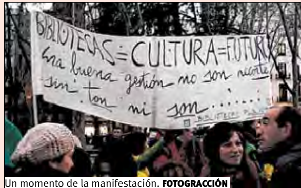
Un momento de la manifestación. FOTOGRAFACIÓN

El pasado 7 de febrero tuvo lugar en Madrid una multitudinaria manifestación en defensa de los servicios públicos bajo el lema "Lo público es de todos. ¡No a los recortes!". Unas 150.000 personas recorrieron la ya habitual distancia que separa Neptuno de Sol. A los sindicatos se unieron la marea verde de la educación, la blanca de la sanidad y la azul contra la privatización del Canal de Isabel II, así como trabajadores del Metro, bomberos uniformados que hicieron caso omiso de la prohibición de manifestarse vistiendo el uniforme, policías de paisano con el lema "Nos han dejado con el culo al aire", funcionarios de justicia, agentes forestales, empleados de la red de bibliotecas públicas de la Comunidad de Madrid, trabajadores sin adscripción profesional específica y, cómo no, compañeros de las distintas asambleas del 15M.