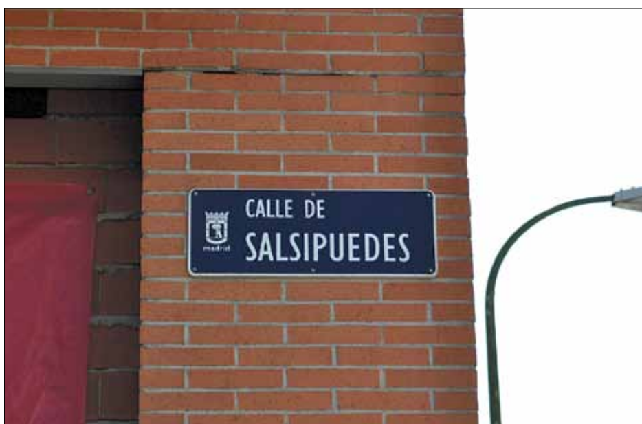
NO ES UNA BROMA, ES EL NOMBRE DE LA CALLE DONDE SE UBICA LA OFICINA DEL INEM EN EL DISTRITO DE VILLAVERDE. VALÈRE ALEXANDER

La asamblea de desempleados y trabajadores/as afectados por contratos precarios la constituyen todas aquellas personas preocupadas por conseguir un empleo digno, base fundamental para alcanzar unas condiciones de vida igualmente dignas.