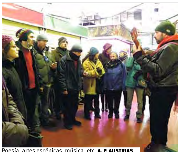
Poesía, artes escénicas, música, etc. A. P. AUSTRIAS

En esta ocasión, el emplazamiento elegido fue el mercado de La Cebada, por dos