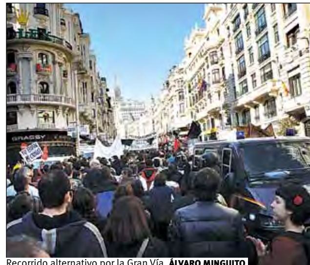
Recorrido alternativo por la Gran Vía. ÁLVARO MINGUITO

Constituidas en un 'bloque crítico', varios miles de personas se sumaron a la manifestación convocada por los sindicatos mayoritarios contra la reforma laboral del pasado 19 de febrero. El bloque se unió al rechazo general por el retroceso en materia de derechos laborales que supone la reforma, a la vez que pretendía visibilizar su disconformidad con las cúpulas sindicales que durante los últimos años han pactado otras pérdidas de derechos.