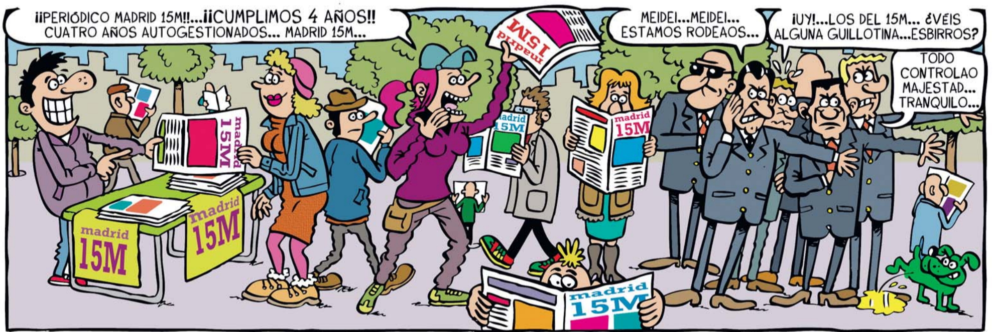
Manolifo Rasf amán...2016 www.elgregario.org

Y en esta reflexión, volviendo un poco a las características del periódico que estás leyendo, me parece necesario destacar la importancia de contar con medios contrainformativos impresos. Aparte de que el periódico, como objeto, da fe de forma física de la existencia de puntos de vista alternativos, y de que es algo tangible frente a la fugacidad de los contenidos en la red, es sobre todo un instrumento inmejorable para hacer llegar más lejos nuestras voces disidentes. Vivimos en una sociedad muy "moderna": tenemos Facebook, Twitter, Whatsapp y qué sé yo cuántas redes sociales más, pero la brecha digital existe y es más grande de lo que parece. A día de hoy, muchísima más gente de la que imaginamos no tiene acceso a internet, bien porque no ha aprendido a manejarse en ella o directamente porque no se la puede permitir (recordemos que el mes pasado hablábamos de la "pobreza energética"). En estos casos, el medio impreso resulta herramienta insustituible para descubrir o confirmar que "otro mundo es posible". Por ello, os animo a crear en vuestros ámbitos todos los que podáis, sean periódicos, revistas, fanzines o humildes "hojas volantes", y tomando prestado el viejo lema del movimiento okupa, grito: "¡diez, cien, mil contrainformativos impresos!".