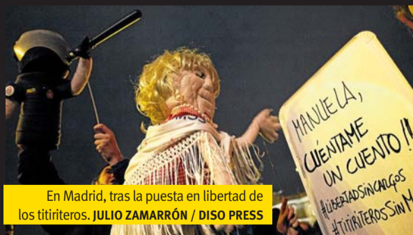
En Madrid, tras la puesta en libertad de los titiriteros.

E l juez de la Audiencia Nacional Ismael Moreno ha ordenado el 10 de febrero la puesta en libertad con cargos de los dos titiriteros detenidos el pasado viernes, 5 de febrero, durante una representación de títeres en las fiestas de Carnaval en Madrid, según han confirmado a Diagonal los abogados de la defensa. El juez ha emitido el auto de libertad tras recibir