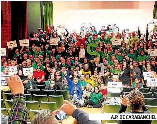
A.P. DE CARABANCHEL

En el III Plenario se presentó el trabajo de las nuevas comisiones. Comisiones como Obra Social, Vivienda Pública, Iniciativa Legislativa Popular, Estafa Hipotecaria, Jurídica y las que vendrán, como Comunicación. Por otro lado, se debatieron y decidieron las posturas unitarias que serán