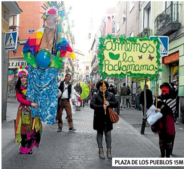
PLAZA DE LOS PUEBLOS 15M

Así, el domingo 7 de febrero la cita fue en Maloka. Empezamos con danzas de Guerreros de Luz y salimos en pasacalle con el Bloco Malokeir@s na Folia, Son y Armonía, Stereo Sam-