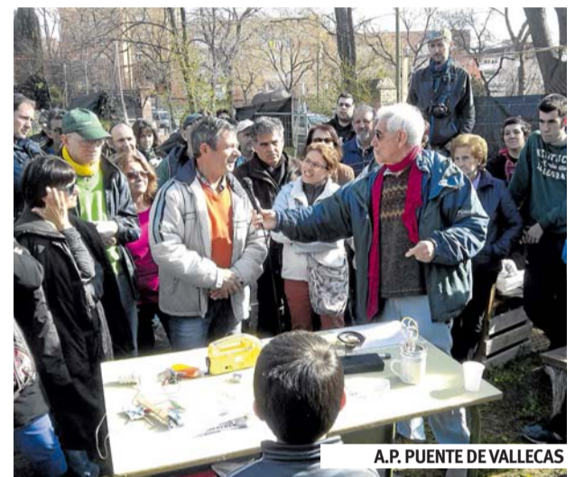
A.P. PUENTE DE VALLECAS