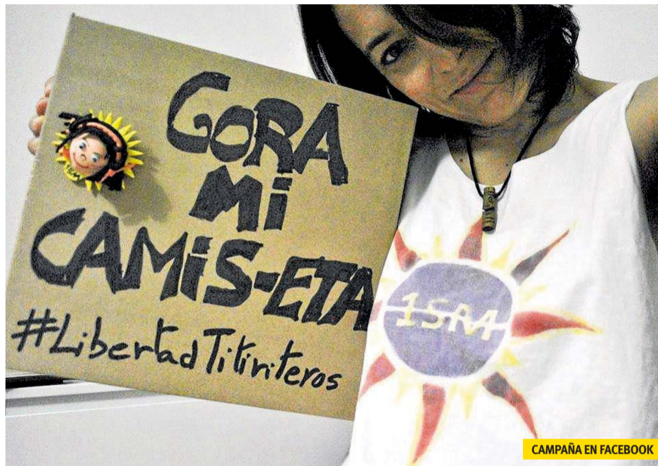
CAMPAÑA EN FACEBOOK

COMUNICADO DE LEGAL SOL ANTE LA DECISIÓN DEL JUEZ ISMAEL MORENO DE ENVIAR A PRISIÓN A LOS DOS TITIRITEROS DE LA COMPAÑÍA 'DESDE ABAJO'